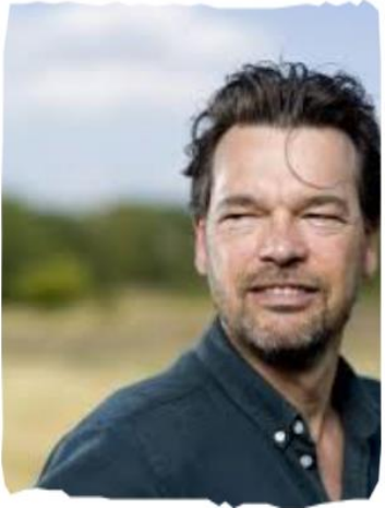
HOE JUMBO VISMA DE BESTE WIELERPLOEG TER WERELD WERD